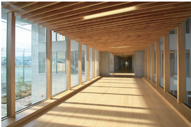
渡り廊下 校舎棟と屋内運動場棟を繋ぐ