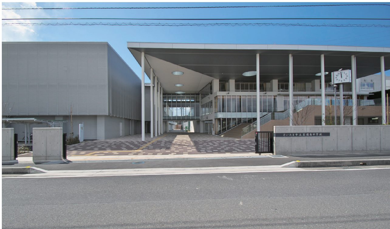
北側外観。正門から一直線に伸びる学びの道が校舎棟と屋内運動場棟を分ける