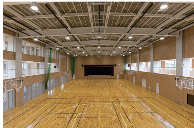
屋内運動場棟 アリーナ