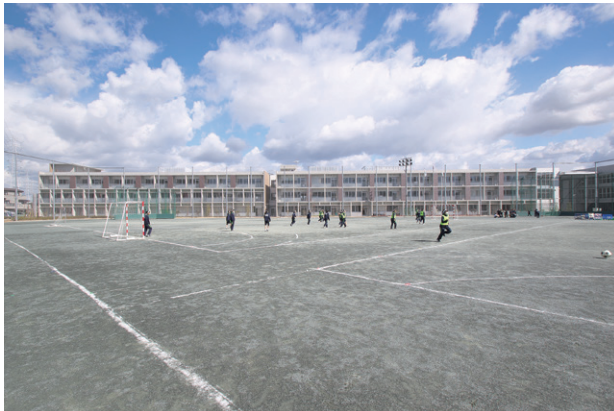
南側外観。グラウンドから見た校舎