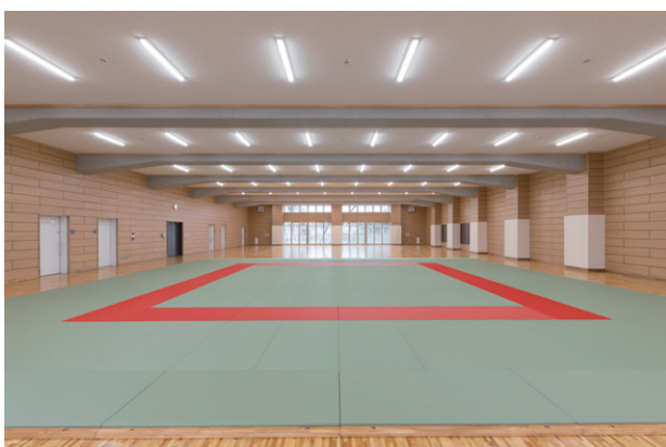
武道場 柔道・剣道に取り組むことができる