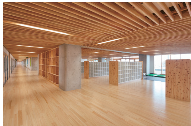
昇降口 床・天井・家具・建具を木質化