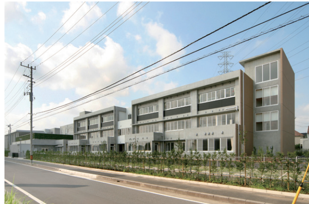
北側外観。1階各特別教室にワークテラスがある